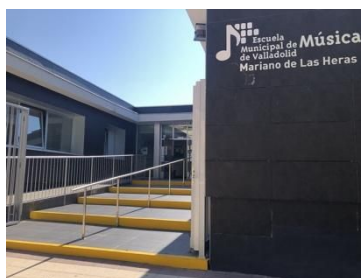
2ª) Entrada anexa del Centro de Personas Mayores