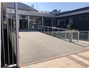
1ª) Entrada Principal a través del C.C. José Luis Mosquera

Para acceder a las instalaciones, existen tres vías de acceso posibles: